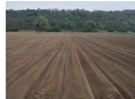
Les pommes de terre sont plantées ! (1,5 Ha).