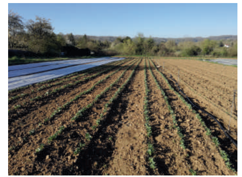
Les fèves se développent !