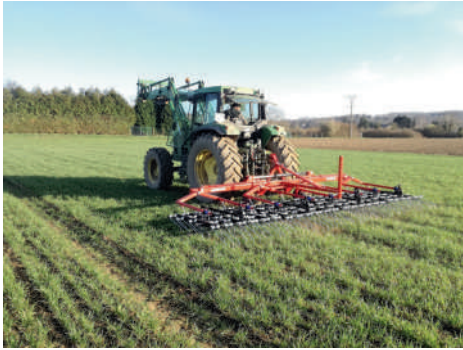
Passage de herse étrille sur notre parcelle de blé (1 hectare)