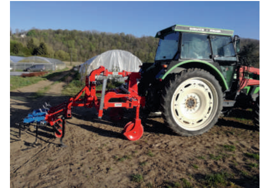
Notre nouvelle bineuse autoguidée par caméra