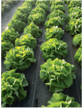
Premières laitues pommées de printemps !