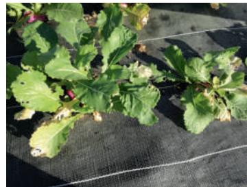
Effets du gel sur navets extérieurs