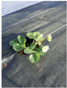
Les fraisiers ont bien repris !