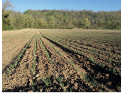
Près de 1 hectare d'échalotes, oignons jaunes et rouges